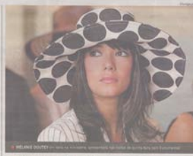
Protagonista de "Claire Stérel" defende o aborto e diz que os franceses são depressivos