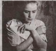
MADMOISELLE - Sandrine Bonnaire

Sandrine Bonnaire estreou no cinema de Maurice Pialat ( A Nos Amours ), mas talvez tenha sido Patrice Leconte quem lhe ofereceu seu mais belo papel (em Confidências Íntimas ). Além de atriz, Sandrine revelou excepcional sensibilidade ao dirigir um documentário sobre sua irmã autista ( Elle S'Appelle Sabine ). Nada melhor do que começar por ela o ciclo que o Eurochannel vai apresentar sempre às sextas-feiras, às 22 horas, durante este mês. Quatro Atrizes Francesas , como anuncia o título, é uma celebração da beleza, do talento e do mistério das estrelas francesas. Sandrine abre hoje a programação com Mademoiselle , de Philippe Lioret, sobre essa garota que se relaciona com uma trupe de atores especializada em performances rápidas. Sua ligação com um deles vai