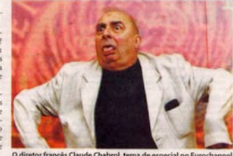
O diretor francês Claude Chabrol, tema de especial no Eurochannel

Por que chamam a isso de "Nostalgia" no Eurochannel? Por acaso Claude Chabrol morreu sem avisar a ninguém? E depois do documentário sobre ele passa "Mulheres Diabólicas", um filme que não tem nem dez anos. A nostalgia agora anda depressa. Antes que ela chegue, vamos ao especial dedicado a esse mestre do policial moderno. Dos cineastas da nouvelle vague , Chabrol é o que menos cultivou o hábito de falar a respeito de si mesmo, de teorizar sobre seu trabalho.